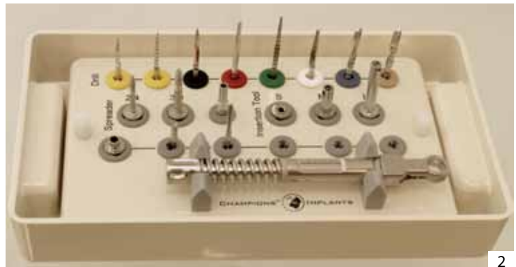
Fig. 1 et 2: Cette année, la «famille» des Champions® s'est agrandie avec les implants en deux pièces. La trousse chirurgicale avec un kit d'instruments dentaires est prêtée gratuitement aux nouveaux clients pour au moins six mois. Le kit sera en possession du cabinet dentaire/clinique dentaire lorsqu'une commande de 50 implants a été passée.

DB: Qu'entendez-vous par « no invest », donc « pas d'investissement»?