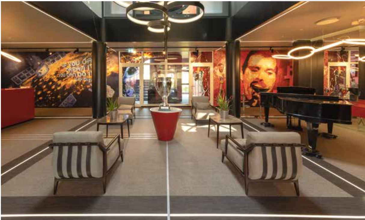
Film: Le Future Center à Flonheim